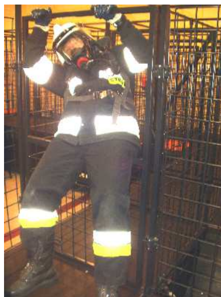
3.26) Krata pionowa