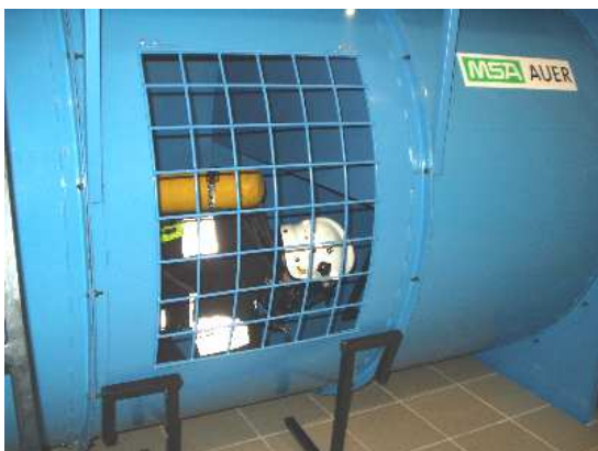
3.3) Zbiornik – przegroda pozioma górną – wyjście na poziom górny