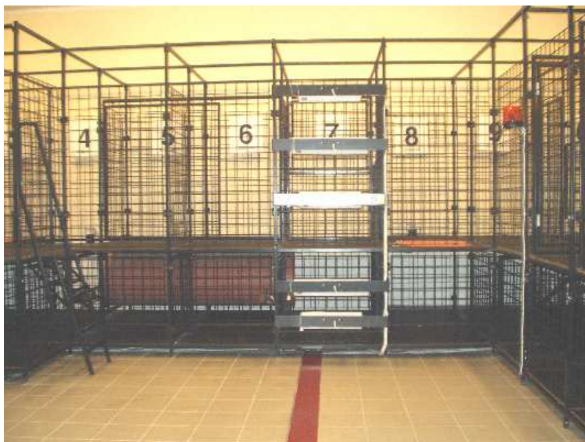
Część środkowa ze strefą termiczną