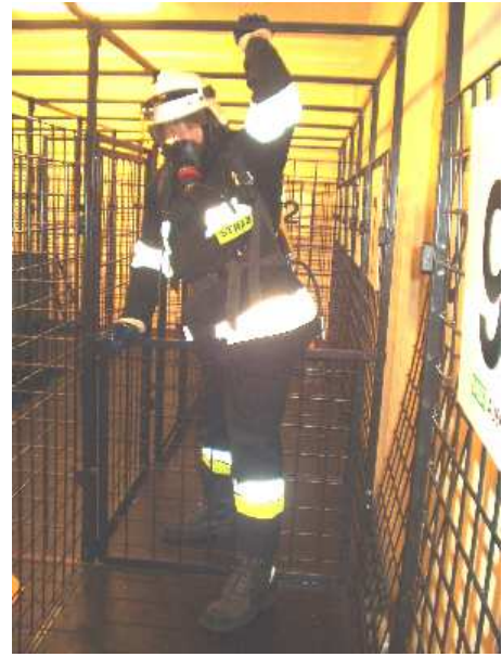
3.13) Okno wahliwe nad kratą poziomą dolną