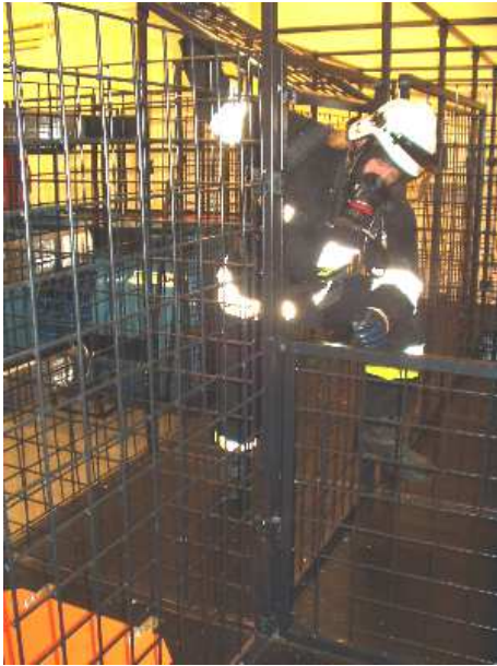
3.14) Krata pozioma dolna