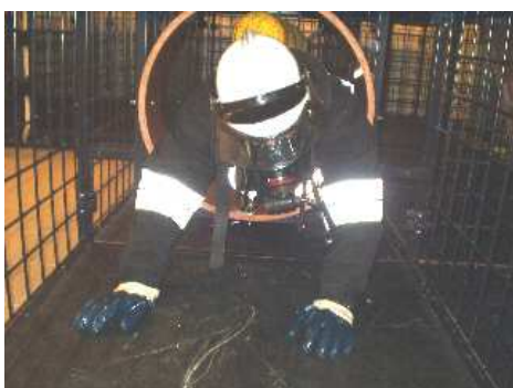
3.21) Rura krótka