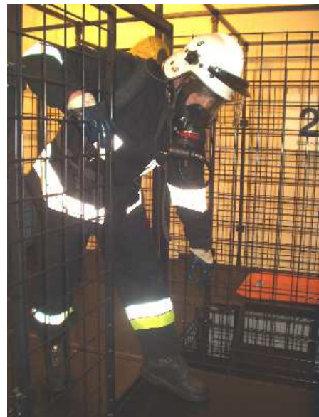
3.12) Drzwi przesuwne wysokie