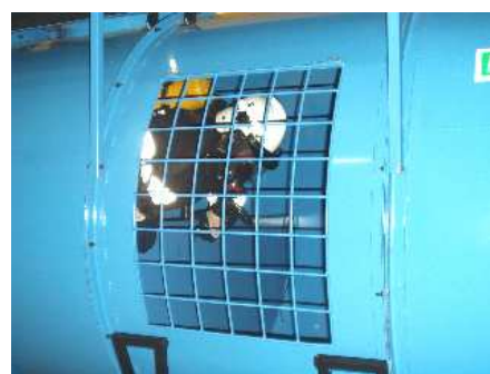
3.2) Zbiornik – przegroda pozioma dolna