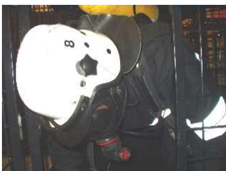
3.7) Krata pionowa lewa