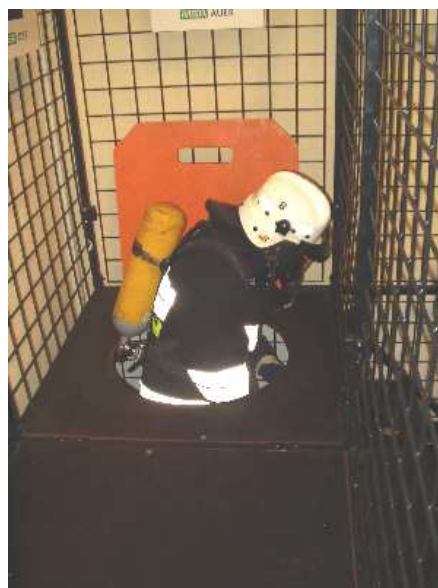
3.4) Właz – zejście na poziom dolny