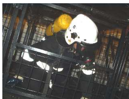
3.6) Krata pozioma dolna