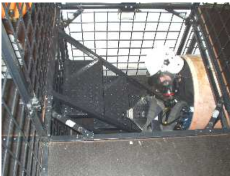
3.11) Wyjście z rury – wejście na poziom górny