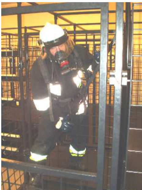
3.25) Krata skośna wysoka