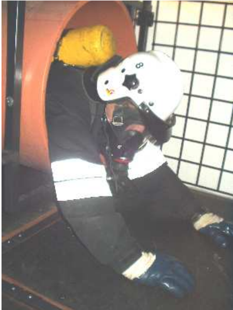
3.9) Rura długa (2m) – aparat oddechowy nałożony