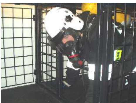
3.5) Krata pionowa prawa