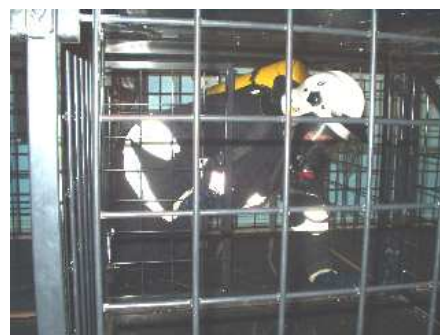
3.18) Drzwi przesuwne niskie