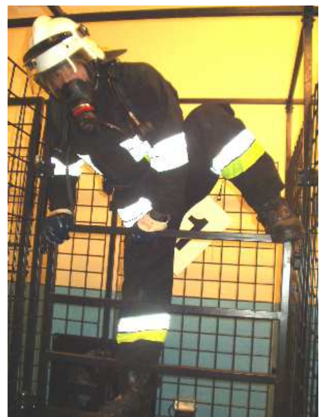
3.16) Przeszkoda drabinka pionowa