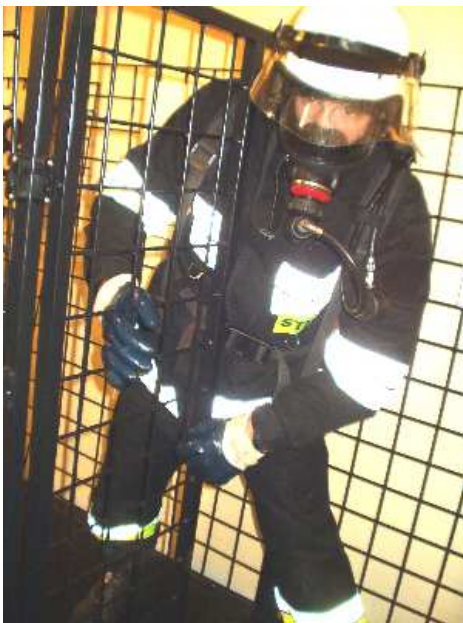
3.15) Drzwi przesuwne wysokie