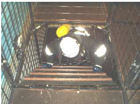
3.23) Pochylnia – wejście na poziom górny