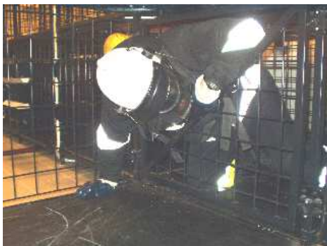
3.19) Krata skośna