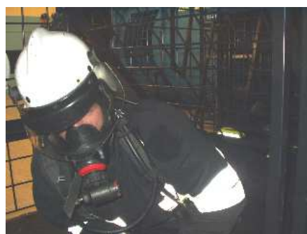
3.8) Okno wahliwe