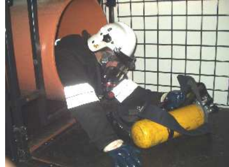
3.10) Przejście przez rurę – aparat oddechowy ściągnięty