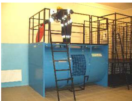
3.1) Wejście do zbiornika - właz