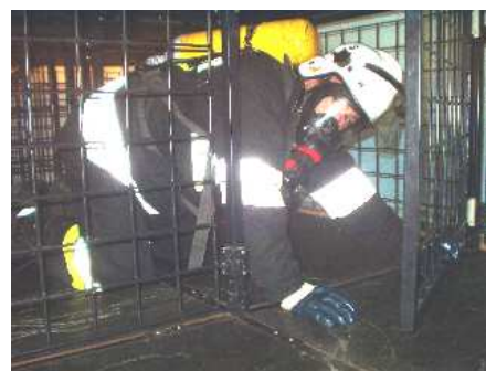
3.20) Drzwi wahliwe niskie