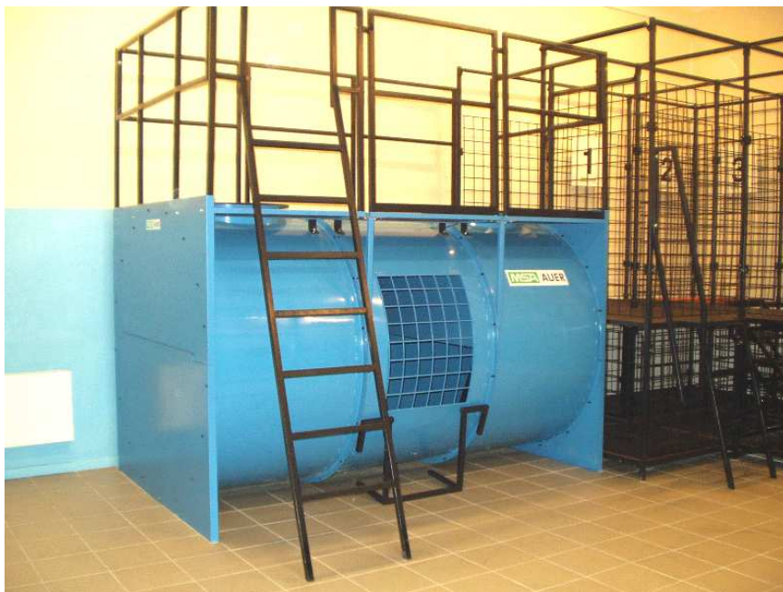
Wejście (zbiornik z dwoma wjazdami)